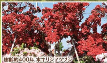
樹齢約400年 本キリシマツツジ