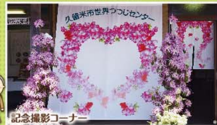
記念撮影コーナー