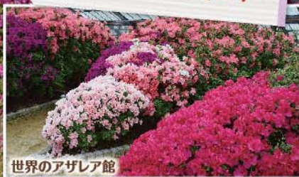
世界のアザレア館