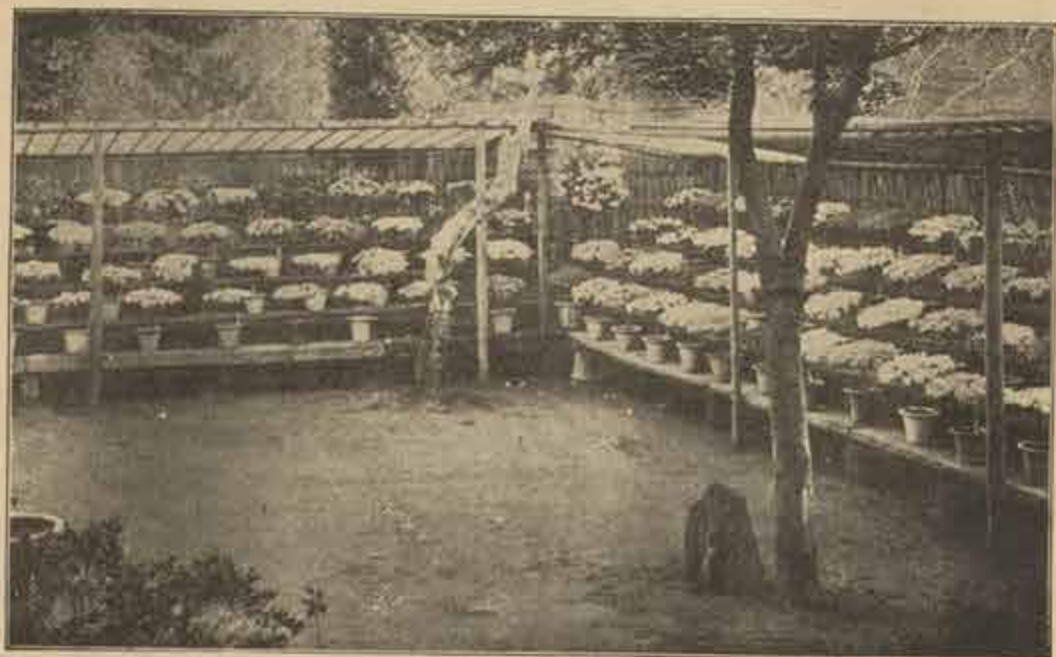
開樂園錦光花満花ノ況