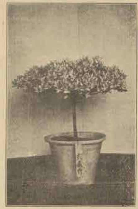
久留米特産錦光花見臺作